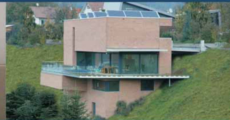
Oberfeldgasse 11, A-6922 Wolfurt