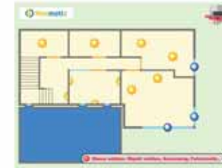
Bedienung via Touchscreen